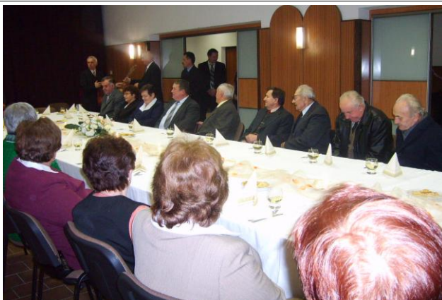
20. 11. 2010 - Tradičné posedenie predstaviteľov obce s 29-timi jubilanťmi