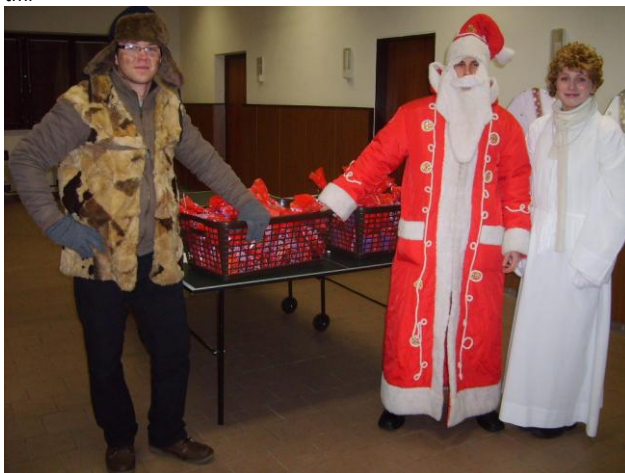
05. 12. 2010 - Aj tento rok prišiel Mikuláš potešiť naše deti