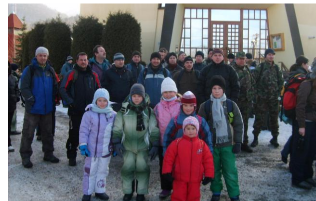
23. 01. 2011 – Tohoročný pochod Slanským pohorím prilákal rekordný počet 90 účastníkov